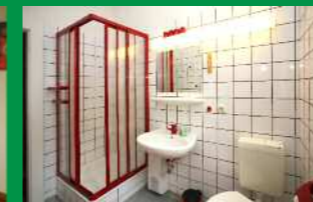
Bad / WC