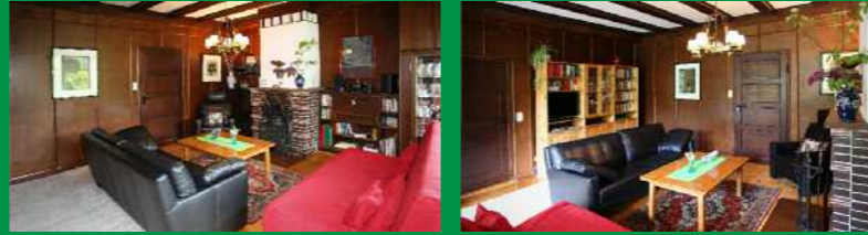
Wohnzimmer mit Kamin