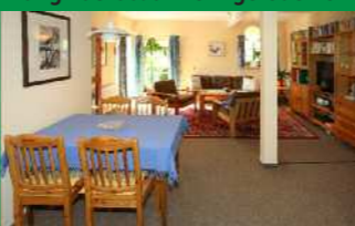
Ess- und Wohnzimmer