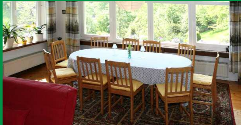
Ausziehbarer Esstisch für bis zu 12 Personen